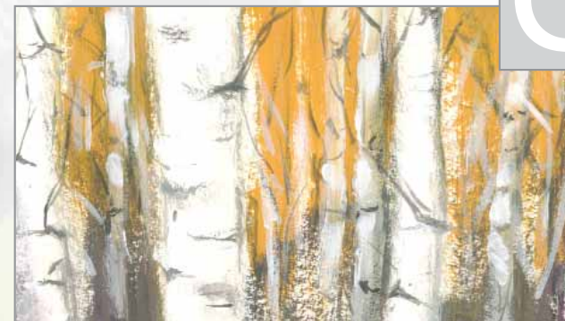
„Birkenwald“ - Technik: Deckende Malweise

Die bekannteste Technik der Gouache-Malerei ist die deckende Malweise. Die Töne der AKADEMIE® Gouache verfügen über eine gute Deckfähigkeit und trocknen zu einer samtmaten Oberfläche auf. Unverdünnt aufgetragen wird der weiße oder farbige Untergrund komplett abgedeckt. In diesem Beispiel sorgt der weiße Farbauftrag mit seinen Werkspuren für einen dezent plastischen Eindruck.