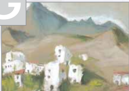
„Nordafrikanisches Bergdorf“ - Technik: Trockene Malweise