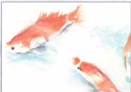
„Fische“ - Technik: Aquarellartige Malweise

Mit der AKADEMIE® Gouache lassen sich auch aquarellartige Malweisen umsetzen. Hierfür wird die Farbe stärker mit Wasser verdünnt und mit weichen Aquarellpinseln aufgetragen. Lasieren, Nass-in-Nass-Malerei und andere typische Aquarelltechniken können umgesetzt und auch mit deckenden Farbaufträgen kombiniert werden. Als Untergrund empfiehlt sich hier ein weißes Aquarellpapier.