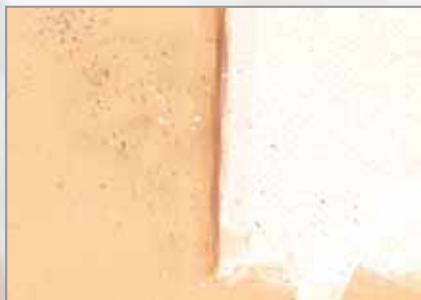
„Küchenkrepp“ - Technik: Abdruckverfahren und Spritztechnik

Farbe auf eine Zahn- oder Spülbürste und spritzen sie die Farbe von den Borsten auf das Bild. Denken Sie daran, die Umgebung mit Papier oder Folie abzudecken. Üben Sie die Spritztechnik zunächst auf separatem Papier, damit Sie ein Gefühl für Farbmenge und Spritzdruck bekommen.