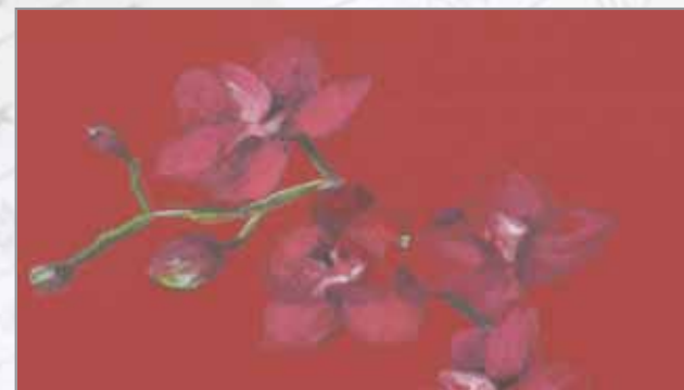
„Rote Orchidee“ - Technik: Weißausmischungen

Aufgrund ihrer Deckkraft finden in der Gouachemalerei insbesondere farbig getönte Untergründe ihre Anwendung. Die Tönung des Papiers beeinflusst dabei die Gesamtwirkung des Bildes. Um die Leuchtkraft der Gouache zu erhöhen, werden die Farbtöne bei einem dunklen Hintergrund oftmals mit Weiß ausgemischt oder untermalt. Im vorliegenden Beispiel sind die Rottöne der Orchidee mit Weiß ausgemischt, während das Grün des Stiels mit Weiß untermalt wurde.