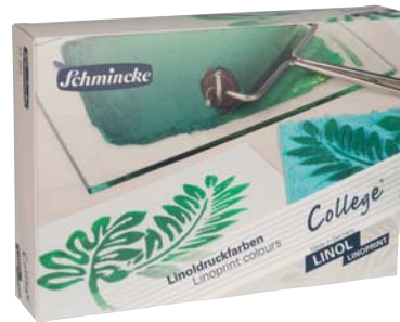
Art. 84 001 Karton-Set/cardboard set 5 x 75 ml