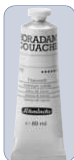
Titanweiß / titanium white in 60 ml