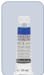
48 Farben / colours in 15 ml