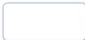
101 SUPRA Deckweiß