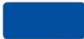
430 Ultramarinblau dunkel