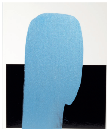
PRIMAcrlyl ® Silber 13 895 (Perlglanzpigment)