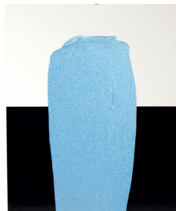
Acryl-Bronze Silber 15 825 (Aluminiumpigment)