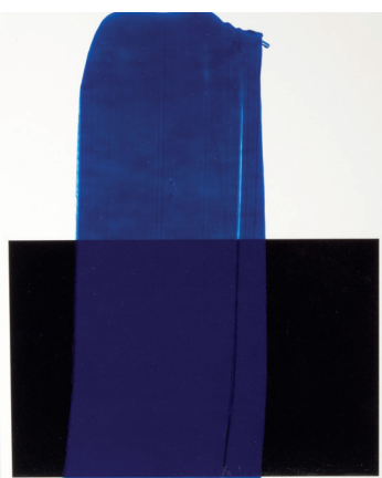
(Farbfilme in 60 µm Filmstärke aufgezo- gen auf eine Kon- trastkarte)

Mischungen von PRIMAcrlyl ® Phthaloblau rötlich, 13 439 mit